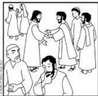
12 e dimanche du temps ordinaire – Année C

Jésus, apprends-nous à donner comme toi, même si c'est difficile. Amen.